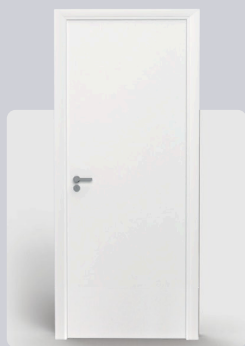
Super Branco New

Cores elegantes que se adaptam a qualquer estilo.