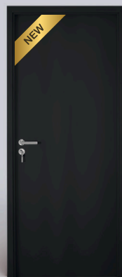
Laca Preto Velluto