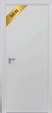
Laca Cinza Velluto